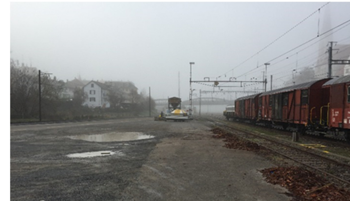
Situation des heutigen Freiverlads