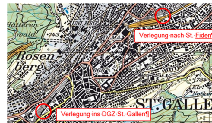
Ausschnitt aus Arbeitsplan zur Ermittlung von Ersatzstandorten