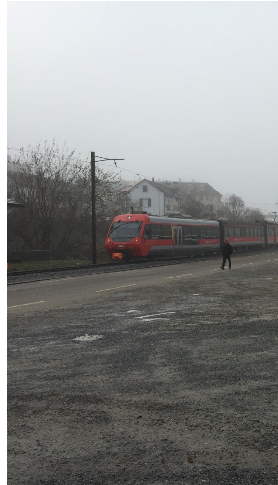
Alte Linienführung der Appenzeller Bahn